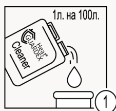
Шаг 1 – Приготовление промывочного раствора