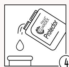
Шаг 4 - Залить защитный ингибитор в систему